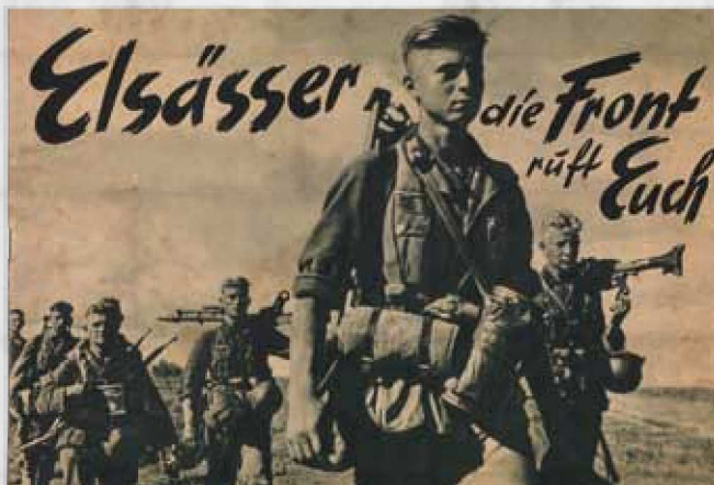
Page de garde d'une brochure de propagande (1942), Collection Tomi Ungerer, 197 J 002.1.371, Archives départementales du Bas-Rhin

Il y a 70 ans – le 10 mai 1940 – la Wehrmacht allemande envahissait les Pays-Bas, après la Belgique, le Luxembourg et la France. Elle occupa les pays limitrophes occidentaux et annexa en France non seulement le département lorrain de Moselle, mais également l'Alsace, qui fut unie au Land de Bade pour former le Reichsgau Oberrhein . A partir du mois d'août 1942, les Alsaciens furent recrutés de force pour servir dans la Wehrmacht . Dans son livre Die Gedanken sind frei Tomi Ungerer a écrit sur lui-même: «Je suis un produit de cette époque». Les expériences du nationalisme qu'il a faites au cours de son enfance l'ont poussé, même après 1945, à réunir une collection très importante de documents et d'objets de la vie quotidienne, de la propagande nazie et de l'anti-propagande des Alliés et des groupes de résistance au cours de la Seconde Guerre Mondiale.