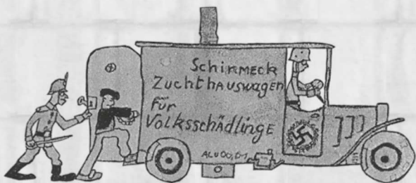
Extrait de: Tomi Ungerer, Les pensées sont libres, Copyright © 1993 Diogenes Verlag AG Zürich

«Si la propagande est une forme de publicité, alors je considère que la propagande nazie est sans pareille dans l'histoire des médias», c'est ainsi que le dessinateur alsacien Tomi Ungerer se souvient du flot de paroles et d'images de la propagande nazie. Né en 1931, Tomi Ungerer vécut au quotidien, entouré de sa famille, l'annexion de sa patrie, d'abord par les troupes allemandes et ensuite par l'administration civile allemande. Encore enfant, il observa avec acuité les répercussions dévastatrices de la guerre lancée par l'Allemagne et de l'idéologie imposée par les Nazis. Pendant les années d'école déjà, il fixa ses expériences, ses observations et impressions dans des dessins critiques et caricaturaux.