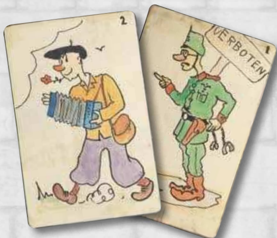
Représentation d'un policier allemand et d'un Français de bonne humeur, faisant partie des cartes de jeu dessinées par Tomi Ungerer en 1943/44, Collection Tomi Ungerer, 197 J 002.3.13 (2) / (8), Archives départementales du Bas-Rhin