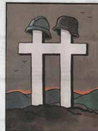
Pour Fr. et D. tombés à la guerre (Destin alsacien), 1990 Musée Tomi Ungerer – Centre international de l'illustration, Strasbourg © Tomi Ungerer

«Si je n'avais pas vécu et finalement trouvé ma voie dans ces années sombres, je ne serais pas devenu l'homme que je suis aujourd'hui. Je ne suis pas un "Malgré Nous", un incorporé de force. Je suis un "Malgré Tout", un activiste envers et contre tout», c'est ce qu'écrit Tomi Ungerer sur lui-même. Le combat contre la guerre, l'extrémisme et la dictature se retrouve comme un fil directeur dans toutes ses œuvres jusqu'à ce jour. De nombreuses distinctions lui ont été décernées en récompense de sa création artistique, mais également de son engagement pour le rapprochement des peuples et pour la paix.